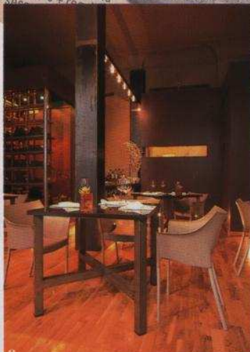
e コンセプトチャルなレストランらしい、スタイリッシュなインテリア。ガラス張りのワインセラーもあり、アイテムも充実。f メインの肉料理は、滋味あふれるジビエとチョコのコンビネーション、「鴨の胸肉 カカオとレモンのスポンジとチョコレートソース」