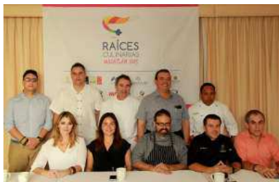
( http://riodoce.mx/wp-content/uploads/2015/10/chefs.jpg )

13 octubre, 2015 por Nelda Ortega ( http://riodoce.mx/author/nelda0 )