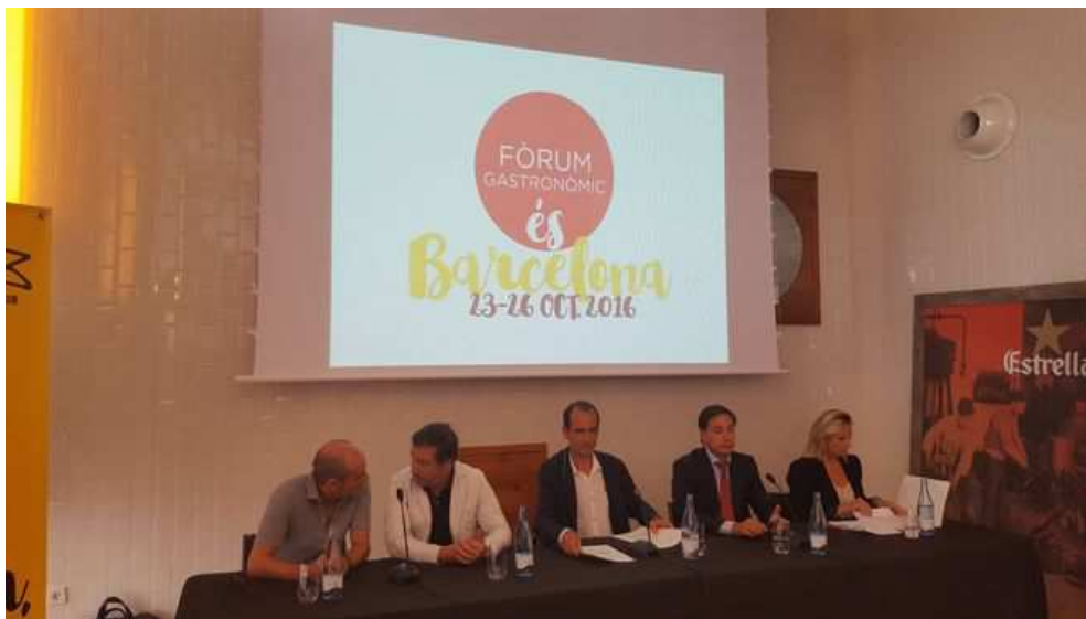
El universo del dulce centrará el Fórum Gastronómico de Barcelona 2016 BARCELONA | EUROPA PRESS