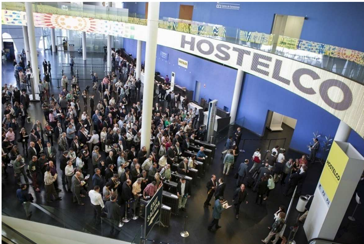
Visitantes de Hostelco durante la anterior edición celebrada en el recinto de Fira Gran Vía de Barcelona.